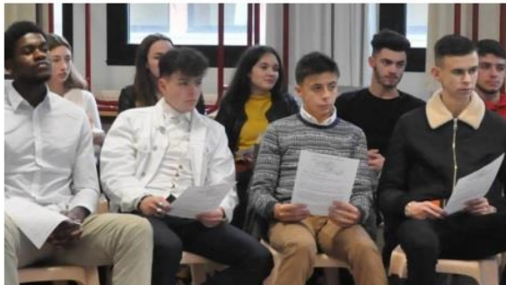
Les élèves à l'écoute du journaliste turc.

Publié le 26/01/2018 à 04:55 | Mis à jour le 26/01/2018 à 10:01 EDUCATION | POITIERS